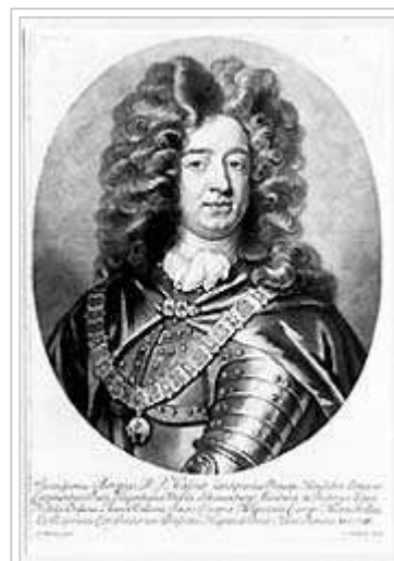
Georg von Hessen-Darmstadt, gobernador de Gibraltar en 1704.

Los sitiados pidieron ayuda a la escuadra de Sir John Leake que se encontraba por aquel entonces en las proximidades de Lisboa, la llegada de los dieciocho barcos del británico coincidió con un intento de los sitiadores de trasladar tres mil