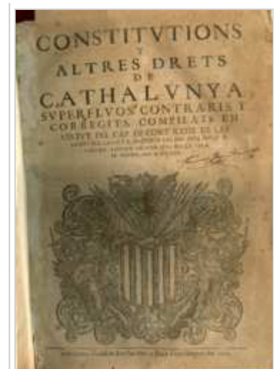
Tercer volum de la compilació del 1585