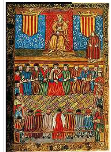
Les Corts Catalanes segons una miniatura d'un incunable del segle XV

Originàriament les constitucions eren les lleis promulgades pels emperadors romans. A Catalunya va persistir el concepte romà i s'anomenaven constitucions de Catalunya a les normes promulgades pels comtes de Barcelona i aprovades per les Corts Catalanes. Les constitucions es diferenciaven dels «capítols de cort» i «actes de cort» pel fet d'aparèixer com a iniciativa del comte, sotmesa a l'aprovació dels braços en les Corts, fet sense precedents a Europa. Tenien preeminència sobre les altres normes legals i només podien ser revocades en les corts generals del Principat. Les constitucions podien modificar fins i tot els Usatges i els privilegis, encara que fossin irrevocables. Com a dret paccionat no podien contradir-se per decrets o sentències reials.