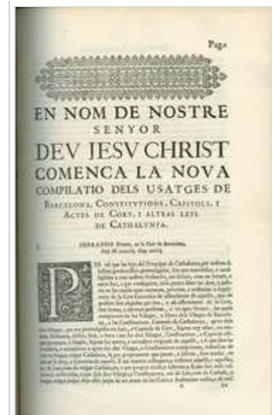
Compilació del 1413

Durant la Tercera Guerra Carlina (1872-1876), les forces carlistes van arribar a ocupar algunes ciutats de la Catalunya interior. Isabel II era a l'exili i el rei Amadeu I, monarca des de 1871, no era gaire popular. Carles VII, nét de Carles V, va prometre a catalans, valencians i aragonesos el retorn dels furs i les constitucions que havia abolit Felip V.