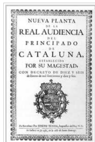
Portada de los Decretos de Nueva Planta