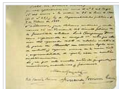
Extracte del sumari manuscrit, on consta la sentència de mort.