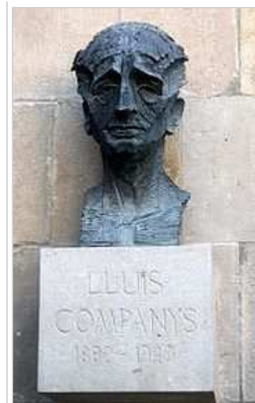
Lluís Companys segons Josep Maria Subirachs.

L'estadi Olímpic de Montjuïc porta el nom de Lluís Companys en honor seu.