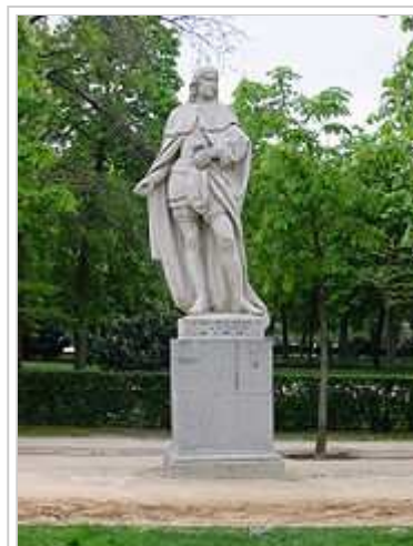
Estatua de Ramón Berenguer IV en el Retiro de Madrid.