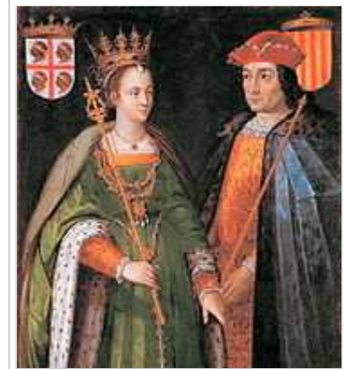
Retratos de la reina Petronila de Aragón y el conde Ramón Berenguer IV de Barcelona, óleo de 1634 (Museo del Prado).