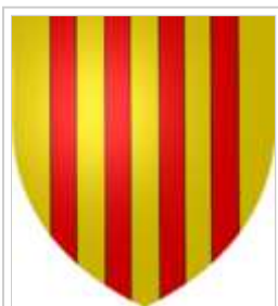
Escudo de armas del rey de Aragón.

Hijo de Ramón Berenguer III y de Dulce I de Provenza . Era nieto por línea paterna de Ramón Berenguer II y de Mafalda de Apulia-Calabria, y por línea materna de Gilberto de Gévaudan y Gerberge de Provenza.