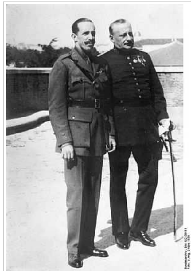
Alfons XIII i el dictador Primo de Rivera, març 1930.

L'hàbit, l'expectació i l'anhel espontani impulsa als militars espanyols de l'edat contemporània a intervenir políticament: 52 intents de cop d'estat militar o pronunciamientos mostren que la intervenció dels militars en els afers polítics és permanent. En el segle XIX es tracta de saber si la revolució política burgesa es produirà o no, mentre en el segle XX es tracta d'impedir la revolució social . [7] Entre les intervencions militars destaquen la regència del general Espartero, el govern moderat del general Narváez, el sexenni revolucionari de 1868-1874, protagonitzada pel general Joan Prim i ja a principis del segle XX el govern del general Primo de Rivera