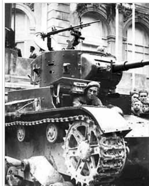
T-26 Model de 1933 amb metralladora DT antiaèria DT a la guerra civil espanyola El 29 d'octubre de 1936 van entrar en combat a la batalla de Madrid. Després ho va fer a les batalles del Jarama, Guadalajara, Brunete, Belchite, Terol i, finalment, a la batalla de l'Ebre. En total van participar 281 unitats, de les quals més de dos terços van ser destruïdes en combat.

Una de les conseqüències de la repressió va ser l'adopció per l'Església catòlica d'una postura netament favorable als nacionals car a la zona republicana va desaparèixer el culte religiós i els incendis als temples van esdevenir un fet quotidià. El nombre de membres del clergat assassinats s'apropa als set mil. Aquest fet va ser greu per al Front Popular perquè la immensa majoria de l'Espanya catòlica va alinear-se contra la República i va concebre la guerra civil com una «croada» o guerra religiosa. Només els catòlics bascos i una part dels catalans van optar per la República. A més, va afectar negativament la imatge de la República a l'exterior. La carta colectiva d'agost de 1937 signada