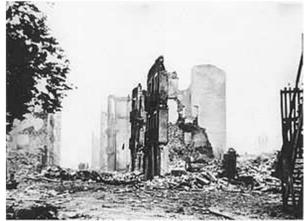
La ciutat de Guernica devastada per l'aviació feixista el 1937