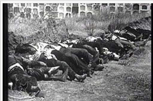
Fotografia de la massacre de Badajoz perpetrada pel bàndol franquista. En els primers dies de la guerra, més de 50.000 persones van ser assassinades o executades

Entre el 5 i el 14 d'agost, la columna motoritzada de la Legió i dels regulars moros, a les ordres del tinent coronel Juan Yagüe Blanco, es dirigeixen a Extremadura des d'Andalusia i acaben amb la resistència dispersa. Ocupen Zafra, Almendralejo i Mèrida. Badajoz és defensada per milícies populars i unitats leials. La batalla és molt violenta i acaba