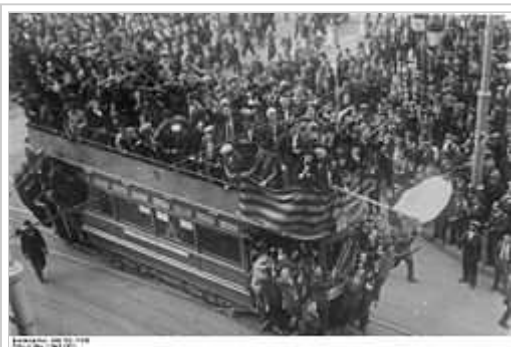
Manifestacions d'alegria popular a Barcelona per la proclamació la Segona República Espanyola.

L'Espanya d'Alfons XIII i republicana era hereva de problemes del passat: el latifundisme irresolt a Andalusia, Castella la Manxa i Extremadura; grans ciutats amb problemes urbans del segle XIX; [8] desequilibris industrials a Astúries, al conjunt siderúrgic de Bilbao i a tot Catalunya amb un proletariat organitzat a l'entorn de la UGT al nord i la CNT a Catalunya, mentre la resta són àrees agràries; els nacionalismes anomenats perifèrics ; [9] una Revolució Industrial pendent a Castella i finalment, els desequilibris religiosos car, durant la II República, l'Església ha fet ostentació de la seva solidaritat amb les classes dominants conservadores. [10]