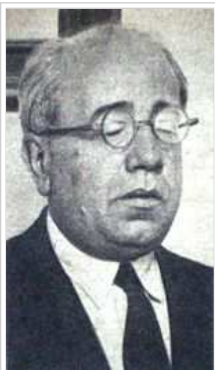
Manuel Azaña, president de la República, a principis de 1936.

La Segona República Espanyola ve néixer amb molts reptes: construir un sistema representatiu homologable a les democràcies parlamentàries occidentals, donar satisfacció a les reivindicacions nacionalistes de Catalunya i el País Basc, resoldre el problema agrari, [11] acabar amb l'analfabetisme, desvincular l'Església de l'Estat, satisfer les primeres reivindicacions feministes, entre d'altres.