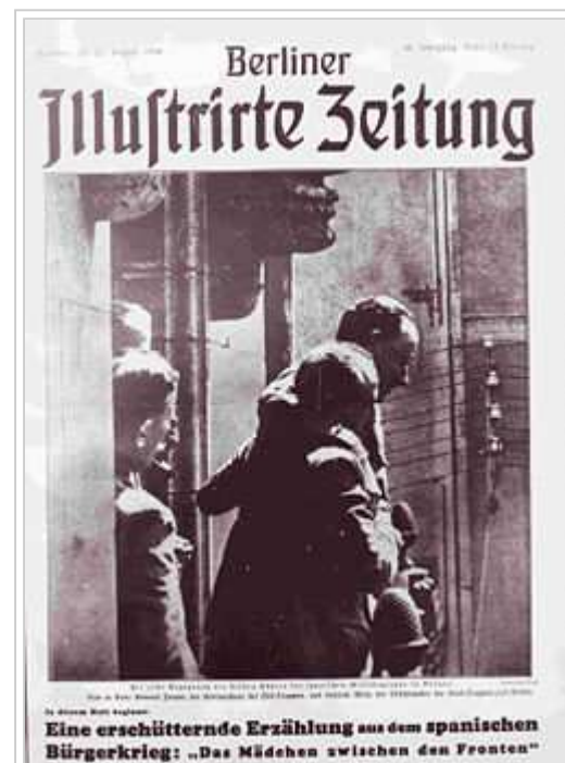
Fotografia de la revista Berliner Illustrierte Zeitung número 35, 27 d'agost de 1936. Al peu de la fotografia esmenta la primera trobada entre els dos cabdills militars espanyols a Burgos. Abraçats, al centre de la imatge hi ha Francisco Franco,

Entre el 5 i el 14 d'agost, la columna motoritzada de la Legió i dels regulars moros, a les ordres del tinent coronel Juan Yagüe Blanco, es dirigeixen a Extremadura des d'Andalusia i acaben amb la resistència dispersa. Ocupen Zafra, Almendralejo i Mèrida. Badajoz és defensada per milícies populars i unitats leials. La batalla és molt violenta i acaba