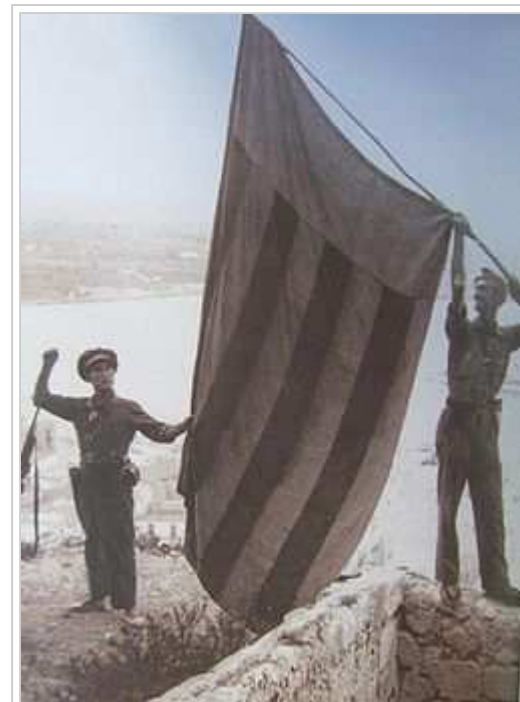
Fotografia de la senyera a Eivissa

comandant de les tropes del Sud, i Emilio Mola, comandant de les tropes del Nord.