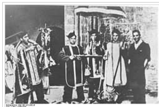
Fotografia de l'arxiu del govern federal alemany i amb la descripció "Manifestació antireligiosa a Madrid durant la guerra civil 1936-39". Com a conseqüència de la revolució iniciada el mes de juliol de 1936 moltes esglésies van ser profanades i incendiades. Als incendis van seguir ben aviat les matances de sacerdots, religiosos i laics significats, i de moltes persones considerades de dretes. A tot arreu on la revolta militar va fracassar, es van produir una reacció popular que va desbordar les autoritats. Amb aquestes matances