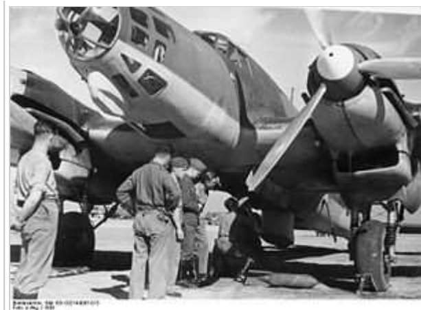
Foto dels arxius federals alemanys amb el títol Espanya, avió de la legió Còndor i la descripció les tropes feixistes d'intervenció alemanyes donen suport al cop d'estat de Franco 1936-1939 contra la República democràtica espanyola .

El 25 de juliol, membres del partit Nazi de Tetuan, emissaris del general Franco, s'entrevisten amb Hitler, qui posa en marxa immediatament una pont aeri per a les tropes del Marroc i promet