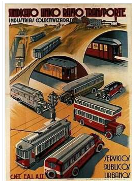
Cartell del Sindicat Únic dels Transports de la CNT sobre la collectivització dels serveis públics urbans.

El govern republicà disposa de les reserves d'or del Banc d'Espanya per pagar importacions de béns essencials i armament. A la seva