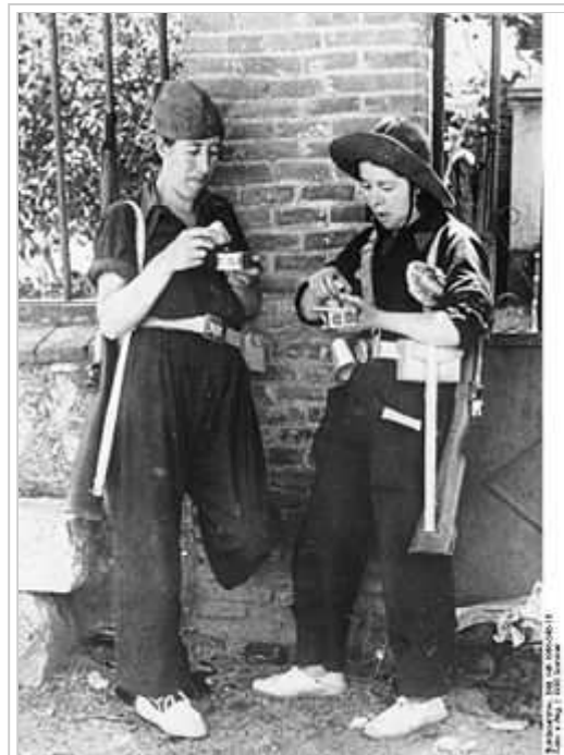
Milicianes al principi de la guerra. Al bàndol del Front Popular el poder va passar del govern a les milícies antifeixistes.

Companys proposà als dirigents anarcosindicalistes la creació d'un nou organisme, integrat per representants de totes les forces polítiques esquerranes i sindicals, que s'encarregués de fer front a l'amenaça feixista. Aquest organisme s'havia d'anomenar Comitè Central de Milícies Antifeixistes. El primer objectiu que es plantejava Companys era reorganitzar les forces armades a través d'aquest nou organisme, i donava aquesta finalitat al Comitè de Milícies, que proposava a totes les forces polítiques i sindicals tot esperant que els anarquistes, essencialment homes combatius, s'hi integrarien i es desentendrien de les qüestions polítiques. [23] Els dirigents van acceptar a condició que l'esmentat Comitè fos l'òrgan superior de Catalunya en els àmbits de política, economia i exèrcit. A partir de la seva creació, el dia 21 de juliol, el Comitè va donar resposta a la nova correlació de forces sorgida després de l'esclafament de l'alçament militar a Catalunya. El Comitè va aplegar representants de les organitzacions sindicals i els partits del Front Popular, tot i que el predomini era netament anarcosindicalista sota les figures de Joan García Oliver, Buenaventura Durruti i Diego Abad de Santillán, que també imposaren un Consell Suprem de l'Economia a Catalunya per a dirigir el decret de col·lectivitzacions a fàbriques i empreses. Joan García Oliver va esdevenir, a la pràctica, el cap del Comitè.