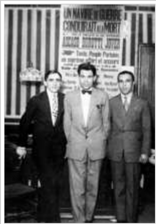
Francisco Ascaso, Buenaventura Durruti i Gregorio Jover Cortés als anys 30.

Companys proposà als dirigents anarcosindicalistes la creació d'un nou organisme, integrat per representants de totes les forces polítiques esquerranes i sindicals, que s'encarregués de fer front a l'amenaça feixista. Aquest organisme s'havia d'anomenar Comitè Central de Milícies Antifeixistes. El primer objectiu que es plantejava Companys era reorganitzar les forces armades a través d'aquest nou organisme, i donava aquesta finalitat al Comitè de Milícies, que proposava a totes les forces polítiques i sindicals tot esperant que els anarquistes, essencialment homes combatius, s'hi integrarien i es desentendrien de les qüestions polítiques. [23] Els dirigents van acceptar a condició que l'esmentat Comitè fos l'òrgan superior de Catalunya en els àmbits de política, economia i exèrcit. A partir de la seva creació, el dia 21 de juliol, el Comitè va donar resposta a la nova correlació de forces sorgida després de l'esclafament de l'alçament militar a Catalunya. El Comitè va aplegar representants de les organitzacions sindicals i els partits del Front Popular, tot i que el predomini era netament anarcosindicalista sota les figures de Joan García Oliver, Buenaventura Durruti i Diego Abad de Santillán, que també imposaren un Consell Suprem de l'Economia a Catalunya per a dirigir el decret de col·lectivitzacions a fàbriques i empreses. Joan García Oliver va esdevenir, a la pràctica, el cap del Comitè.