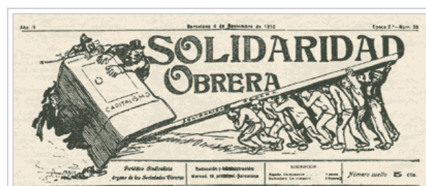
Imatge de la capçalera del diari anarquista Solidaridad Obrera, del 4 de novembre de 1910, on es pot veure uns obrers que fan palanca per tombar el capitalisme.

Si existeix un imaginari d'una intervenció militar ràpida i efectiva, també existeix un imaginari de la revolució que va arrencar amb la crema de convents, els primers ja l'any 1835. Joan García Oliver, militant de la branca revolucionària de la CNT (Los Solidarios), futur ministre de justícia dels governs de la Guerra Civil espanyola, farà servir el concepte de gimnàstica revolucionària (accions col·lectives d'entrenament fins al cop revolucionari decisiu). Idees