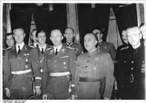
Trobada a Espanya del general Franco i Heinrich Himmler (cap de les SS), amb Ramón Serrano Suñer, 1940. Hitler va decidir intervindre en la guerra civil espanyola des del 25 de juliol de 1936. Per a la historiografia franquista tardana aquesta intervenció va ser a la vegada