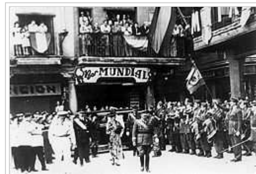
Al peu de foto: "visita del general Franco a la ciutat de Reus. 1940". Francisco Franco va rebre de la corporació municipal la medalla d'or de la ciutat l'any 1944. El 2006 l'Ajuntament de Reus va retirar la distinció honorífica de la ciutat al dictador. En el marc d'una votació secreta i individual -tal com estipulava el reglament orgànic municipal-, l'acord plenari de retirada de la medalla va rebre 20 vots favorables i 4 vots negatius, tants com regidors del PP hi havia al consistori i que s'havien mostrat contraris a aquesta iniciativa anteriorment. La sessió plenària de l'Ajuntament retirava així aquesta distinció honorífica al general Franco enmig dels aplaudiments de membres de la comissió d'Honors i Distincions del consistori.

Tots els partits polítics i sindicats van ser proscrius i perseguits, la llengua i la cultura catalanes van ser prohibides públicament, arreu es va imposar una dura reacció social, i al carrer va irrompre una nova simbologia plena de