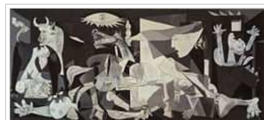
Pablo Picasso, Guernica . La Guerra Civil espanyola va ser també un exemple de guerra total, on el bombardeig de Guernica per la Legió Còndor, presagiaven alguns dels episodis més sagants de la Segona Guerra Mundial.

« La guerra posà també en relleu no ja l'existència de dues Catalunyes, la dels rojos i la dels franquistes, sinó la de tres: la tercera era la d'una majoria que, havent estat de la República i de l'Estatut, ja no era ni de l'una ni de l'altre, com aquell català que respongué, a la pregunta de quin havia estat el dia més feliç de la seva vida, «el 25 de gener de 1939 (recordant que els franquistes ocuparen Barcelona el dia 26 d'aquest mes)