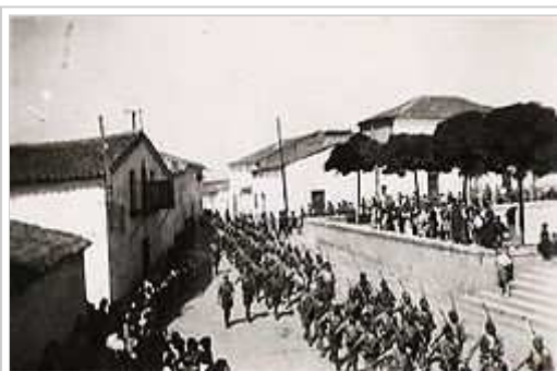
Entrada de l'exèrcit franquista durant la Guerra Civil a Guareña, Badajoz, 1936.

Faccions a l'inici de la Guerra Civil Espanyola. En blau la zona nacional i en vermell la zona republicana. El color verd representa les conquestes ràpides de les columnes nacionals contra les milícies republicanes.