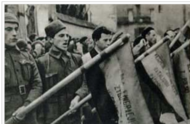
Voluntaris poloneses jurant fidelitat a la República.

Els combatents voluntaris internacionals van incorporar-se a les milícies durant els mesos de juliol i agost del 1936. A partir del mes de setembre